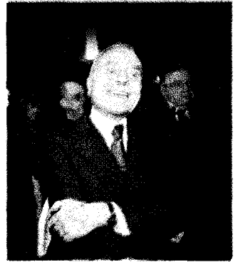
Il sottosegretario Gianni Letta