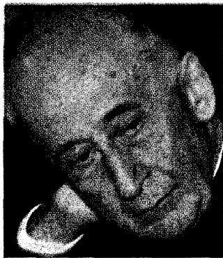
Il cardinale Camillo Ruini